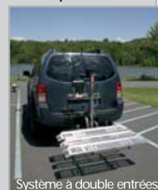
Système à double entrées