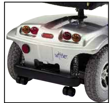
Feu de freinage automatique