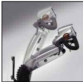
Inclinaison du guidon réglable à l'infini